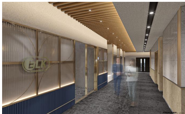
エントランスファサード