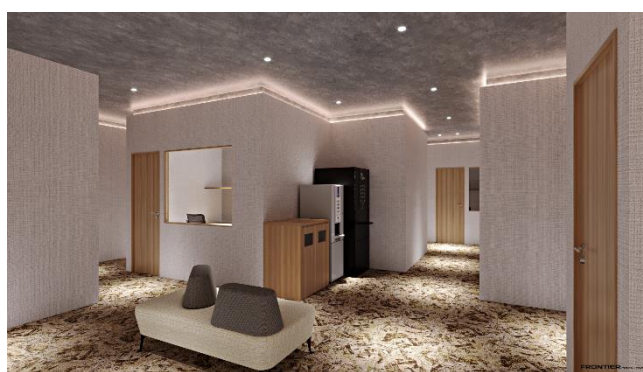
プライベートエリア